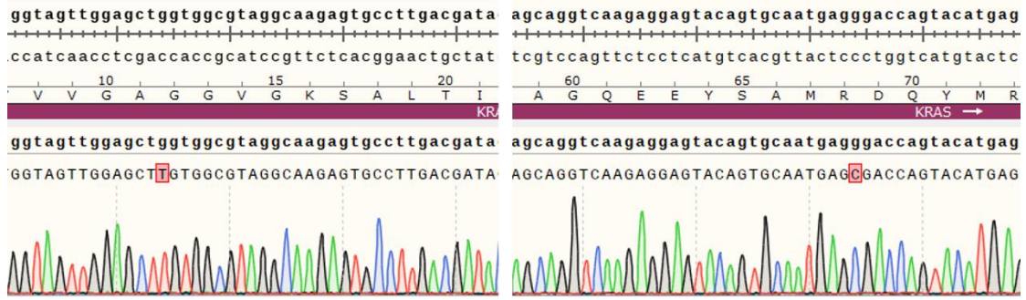
Fig 2. H_KRAS(G12C-R68S) BAF3 Cell Line 测序结果